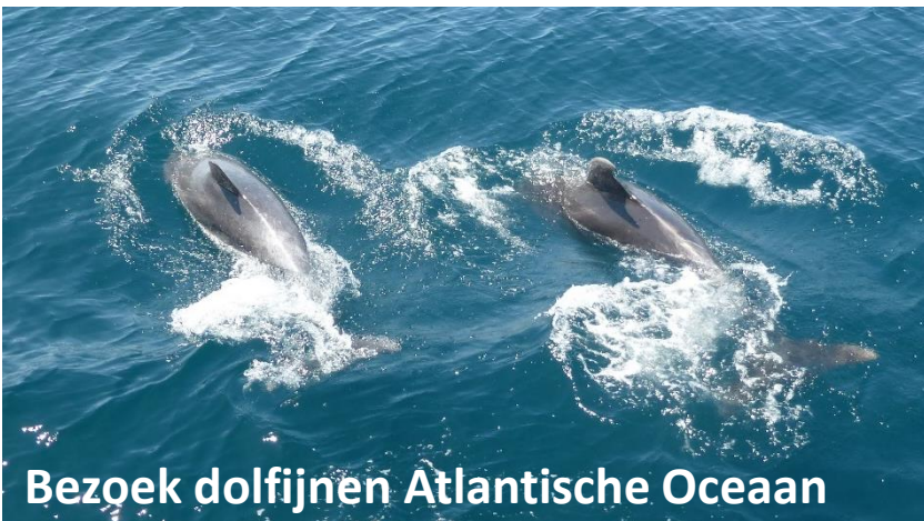
Bezoek dolfijnen Atlantische Oceaan