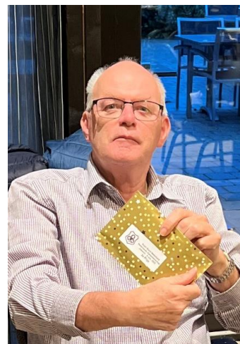
3 e Bert Mes